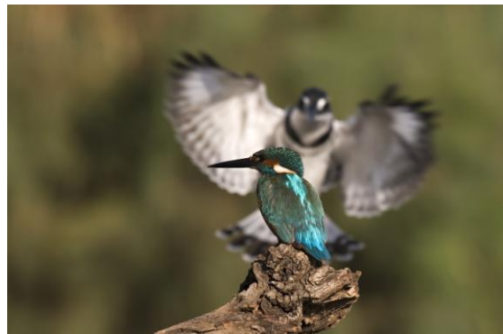
שלדג גמדי וברקע פרפור עקוד (מין שלדג גדול יותר)

היום אני משתמש במצלמה דיגיטלית, עם מגוון עדשות מרחבות זווית לצילום נוף ועד לעדשות ארוכות מוקד (טלסקופ) המיועדות לצילום מרחוק.